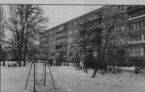
Заседание комиссии по социальной политике городского Совета народных депутатов

Работником приюта для бездомных животных было указ-