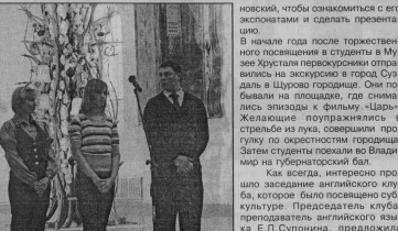
Студенты ВГУ в г. Гусь-Хрустальный

участие в городских соревнованиях среди учащейся молодежи. Основная цель этих мероприятий - воспитание духа солидарности, единения, взаимной поддержки.