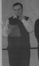
Юнкоровский пост школы.

Особый восторг в концерте вызвали переклассники и перво-