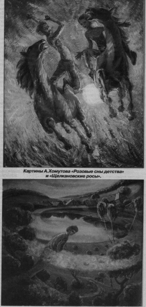
Картины А.Хомутова «Розовые сне детства» и «Щелкановские росы».

На шопл шаг. И постоянно был в ночи. На перекрестках выбирал не ту дорогу. За горизонт смотрел, но гонимому. Ни огнька свечи. Но к неживотному упрямо шел ятот. По старому пути - один чертпопых. Ни ручья, - крутом одно болото. Он гулял предостерегающего гл... И в крик - душа. Был в колокол набатом кто-то.