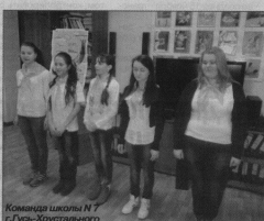
Команда школы N7 Гусь-Хрустальный

В следующем конкурсе «Разминка» команды вспоминали птиц - гербов песен, мультифильмов, стихов. В конкурсе «Заблудившиеся родители» нужно было составить парку родителей - птенца. Большинство команд успешно справились с этим заданием. Затем ребята раскрывали самца крапы - оленьки. А в завершение игры вывесили «черный ящик», и по словесному портрету нужно было угадать птиц, находя-