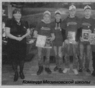
Команда Мезинской школы

щих в нем. Там прыгались длиннозвонкая синица, кедровка, стриж, певчий дрозд, жаворонок. В итоге победителями стали команды Уршельской и Мезинской школы. 2 место поделили команды Демидовской и Курловской школы N1. На 3 месте команды Добрынской и городской школы N7.