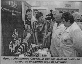
Врио губернатора Светлана Орлова высоко оценила качество владимирской продукции.

Вопрос сбыта продукции на внутреннем рынке был поднят