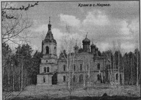
Храм в Нарве.

Единовременная выплата в размере, предусмотренном законом Владимирской области «О единовременной выплате членам семей некоторых категорий военнослужащих и сотрудников органов внутренних дел» будет осуществляться с апреля по июнь текущего года.