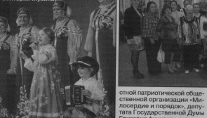
Гусь-Хрустального прибыли на комфортабельном автобусе.

Подобные культурные выезды в соседний наш регион организованы благодаря совместной инициативе председателя обла-