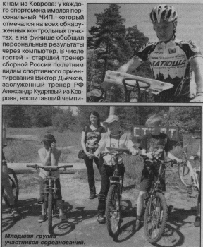
Младшая группа участников соревнования.