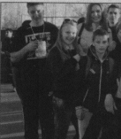
Гусевцы на III жиг-хоп экстрим-фестивале в Иваново.

тоже, д. 16-14 и дворовая площадка в частном секторе по улице Хрустальчиков. Во дворах победителей в ближайшее время будут установлены детские спортивные площадки, которые включают в себя элементы, как для подростков, так и для малышей. На каждую из них выделено по 100 тысяч рублей. Хотелось бы мальчишки и девочки активно занимались спортом, а не сидели целыми днями у компьютеров. Лучше всего, если они будут проводить свое сво-