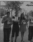
Участники акции «Роботы наши меньшие».

Продолжит работу в данном направлении, в начале года был объявлен конкурс «Лучший двор