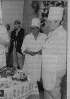
Жюри за работой. Дегустация.

элементы оформления, порционирование, оформление меню, сервировка стола, посуда также вкусовые качества, как тожность аромат, новые вкусовые сочетания и многое другое. Домашнее задание предлагало презентацию кондитерских изделий и номер художественной самодельности силами группы поддержки. Это были песни, а одно