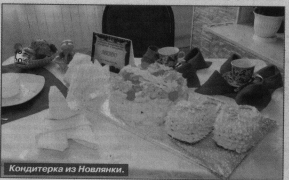
Кандидатка из Новлянки.