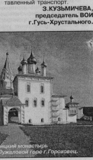
Троицкий монастырь на Пужаловой горе Г.Горохово.