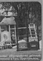
На фото А.Урицкий: обустройство детской площадки на ул.Калинина в Гусь-Хрустальном.