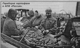
Переборка картофеля в АПФ «Россия»

Нынешний год был тяжелым. Непрекращающиеся дожди не позволили в полном объеме