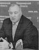
Вице-губернатор Г.Амелин: «У Владимирской области есть огромный потенциал, чтобы стать экономически более развитым регионом».

логистических центры и индустриальные гарки. Скорее всего, этому центру будет придан статус «особой экономической зоны», сообщил Г.Амелин.