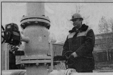
Только при условии выполнения графика погашения долгов «Газпром» продолжит инвестировать средства в газификацию области

полнения регионам области погашению задолженности за поставленный газ Владимирская область будет включена в инвестиционную программу «Газпром» на 2014 год.