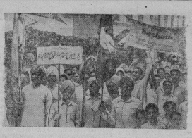
В Джауландуре (Индия) состоялся Третий Всендийский съезд сторонников мира. На нем присутствовало около 350 делегатов и более 500 гостей. В заключительном заседании участвовало более 15 тысяч человек. На снимке: колонны сторонников мира—участников демонстрации в Джауландуре в честь съезда.

И. Палачев, государственный инспектор по торговле