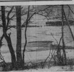
День, другой. Лед хрустит поспереле. И воды затопит эту марь. И грачи на прадесурной сходке Утвердят весенний календарь.