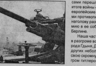
«ГУСЕВСКИЕ ВЕСТИ» - ВАША ЗАГАТА!

В декабре по старому отсчету — день имени Николая Чудотворца, записан в половецком четвертого века, примерно в 352 году. В Русской летописи — это 19 декабря. А Нисея-византийская — 9 мая старого стиля в честь перенесения его мощей из Мар Липидис (Ма-