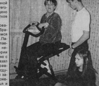
Некоторые дети-инвалиды в этом году побывали в Москве в школе здоровья. У нас в городе более 500 детей-инвалидов, они миллионы по нашей стране, но все, как в столице. На сцене: утренняя зарядка в трансконцертном зале для больных ДЛБ.