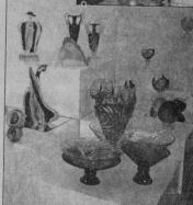
Одновременно велась переговоры с несколькими зарубежными компаниями на предмет поставки нашей продукции и развития сотрудничества. С представителями нескольких фирм, заинтересованных в партнерских связях, переговорный процесс был решено завести по Франкфурту-на-Майне (Германия), которая состоит в Европе.