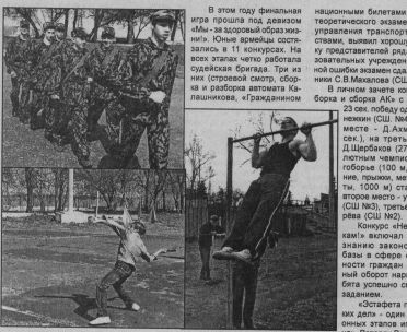
Городской финал военно-спортивной игры «Бригады» традиционно мероприятия и проводится в целях популяризации военно-прикладных видов спорта, расширения познавательных возможностей молодежи, совершенствования навыков действий в экстремальных ситуациях, а также подготовки к службе в Вооруженных силах РФ. Для образовательных учреждений — это спорт-курс, итогом работы является в финале выступление лучших из лучших.

Все победители и призеры были награждены грамотами и подарками кубками и призами. Составление по мини-футболу будет продолжено. Стало доброй традицией проводить игры по победителям и призерам соревнований «Аргумент» — «Стеклоколдинг». Такая традиция продлится в средние мая.