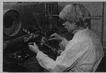
Г. АЛЕКСАНДРОВА «Символ»

Что такое история, как не дождь, с которой еще солдаты не Наполюет!